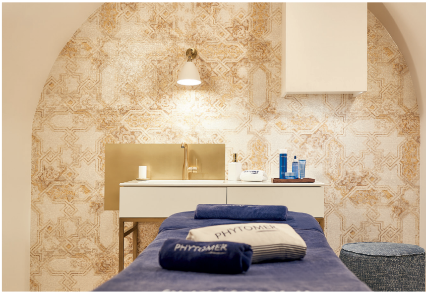
Phytomer Spa étoile

Dans le confort et l'intimité de notre Spa, laissez-vous embarquer par une vague de bien-être. L'occasion de vous ressourcer, de vous accorder une pause bien méritée, et d'offrir à vos proches un précieux moment de détente.